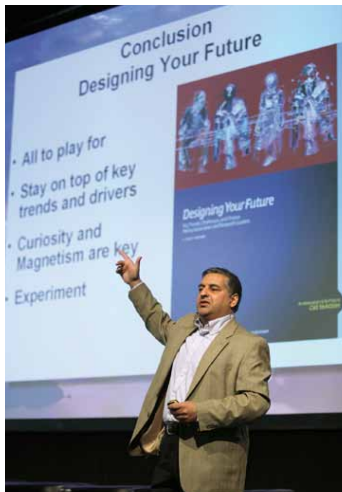
Auf der Suche nach nachhaltigen Geschäftsmodellen: Zukunftsforscher Rohit Talwar

Als Beitrag zu mehr Nachhaltigkeit hat sich das Forum auch die Nachwuchsförderung auf die Fahnen geschrieben. Zu dem Event waren sieben Uni-Absolventen aus allen Teilen der Welt eingeladen, die damit für herausragende Abschlussarbeiten zu touristischen Nachhaltigkeitsthemen belohnt wurden.